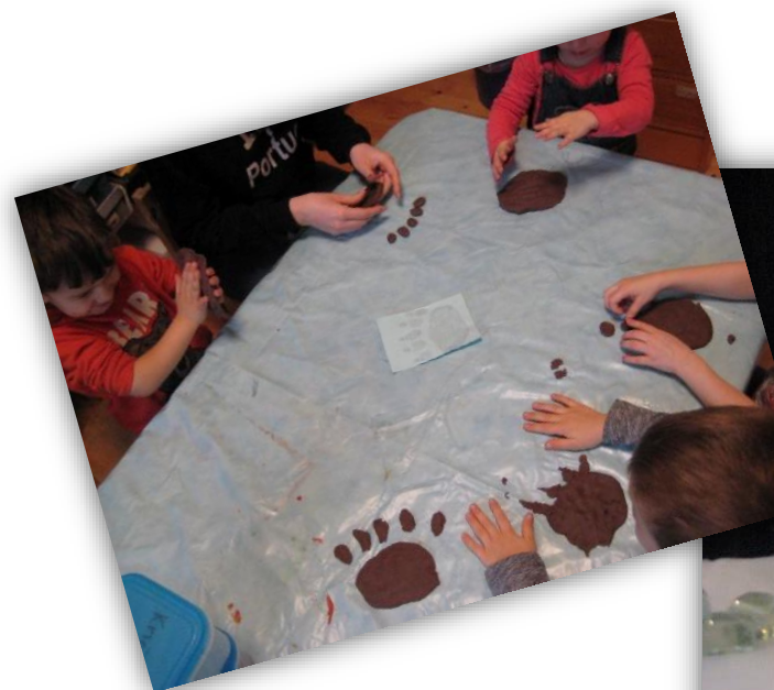
Knut der Eisbär