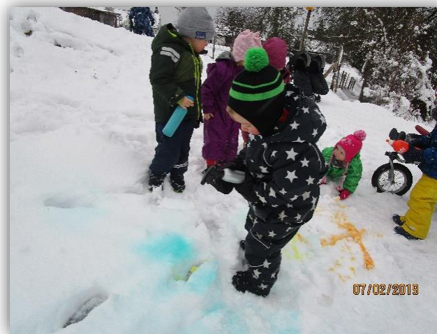
Colorina, die farbige Socke