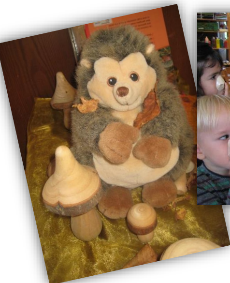
Nick der Igel

Unser Bildungskonzept Elmar beinhaltet, dass wir mit den Kindern über mindestens zehn Wochen ein Thema intensiv bearbeiten. Die Angebote finden einmal am Tag statt, indem wir spielerisch und fantasievoll, mit viel Bewegung den Kindern das Bildungsprojekt näherbringen. Hier einige unserer Projekte: